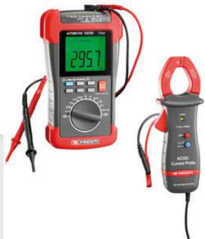
Für alle 10 Finalisten:

Mehr als nur 1 Gewinner Bereits nach der Vorausscheidung gab es nur Gewinner: Die 10 Besten erhielten je 1 Multimeter-Set von Facom im Wert von je CHF 499.-, Platz 2 und 3 (der jeweiligen Kategorie) einen hochwertigen Chronographen von Certina im Wert von 1'470.- und schliesslich der Hauptpreis für die beiden TechnoStars: Der beste Profi und der beste Rookie besuchen gratis und franko als VIP-Gäste des Technomag-carXpert-Teams den Grand Prix von Katalonien vom 13. bis 15. Juni 2014 in Barcelona. Sie lernen den Mitarbeiterstab des Moto2-Teams kennen und erleben die aufregende Stimmung hautnah.