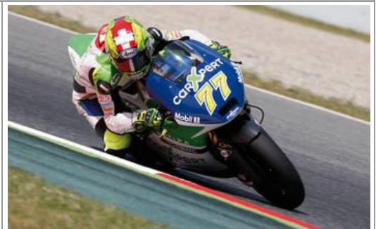
1. Platzierte: VIP-Gäste am Grand Prix

Drei Wochen nach der Messe empfing ein Expertenteam im Ausbildungszentrum Hunzenschwil, die zehn Finalisten zum Praxisteil, um den besten Profi und besten Rookie zu küren.