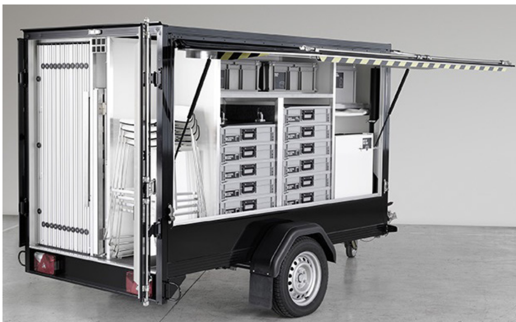
OUT OF THE BOX – der komplette Promotionstand mit PromotionGame und auch sonst Alles dabei

OUT OF THE BOX ist also eine bis ins kleinste Detail clever durchdachte Lösung, mit dem Ziel, Kosten auf der gesamten Front zu sparen. So ist ein Aufbau für einen Stand bis 40 m 2 , werkzeuglos in ca. einer Stunde zu realisieren, weil sogar die Alu-Rahmen mit den Stoffwän-